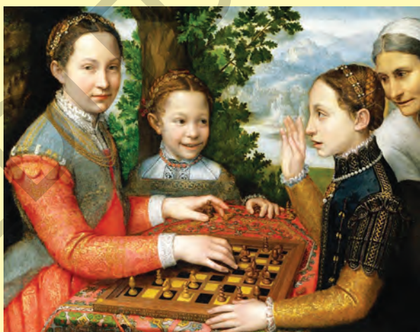
Sofonisba Anguissola, Joc de șah (1555), ulei pe pânză, Muzeul Național din Poznań

Sofonisba ANGISSOLA (1532-1625), pictoriță născută la Cremona, în provincia Lombardia din nordul Italiei, reprezentantă a Renașterii târzii (începutul secolului al XVII-lea). A avut cinci surori, toate pictorițe, ea devenind cea mai cunoscută dintre acestea. Este, în același timp, una dintre primele femei care au dobândit reputație în pictura universală.